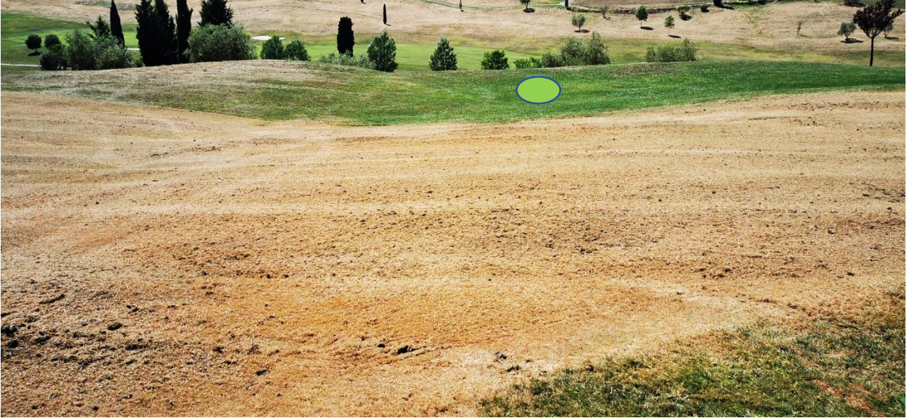
BUCA 4 E 13 VISTA DI LATO