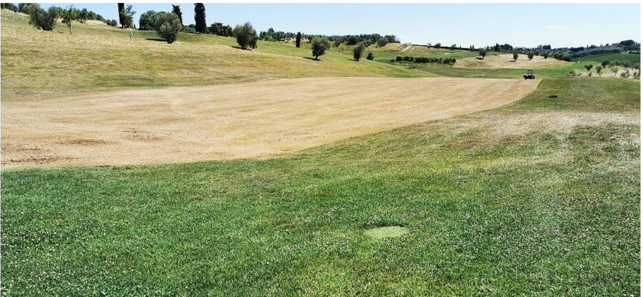
BUCA 4 E 13 VISTA LATO BUCA